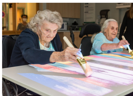
Des résidents essaient le nouveau projecteur interactif Mobii.

Présidente du comité de la qualité des soins